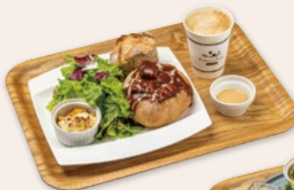
やわらかビーフシチュー セット