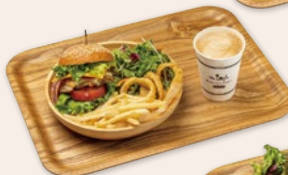
伊豆黒米パンズの チキンバーガーセット