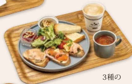
3種の タルティユセット