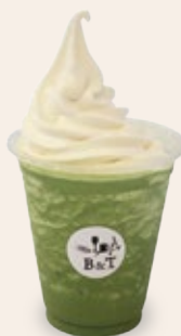
濃厚抹茶 スムージー