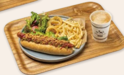
フライドオニオンドッグセット