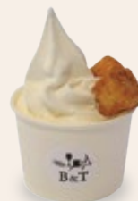
東府や ソフトクリーム